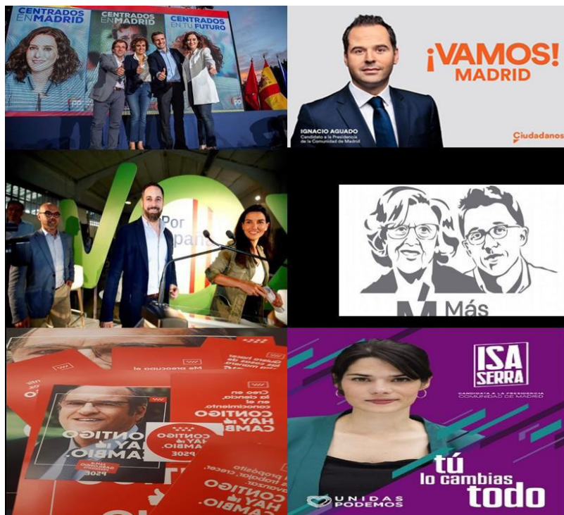
Imagen 2. Carteles electorales campaña autonómicas Madrid 2019.